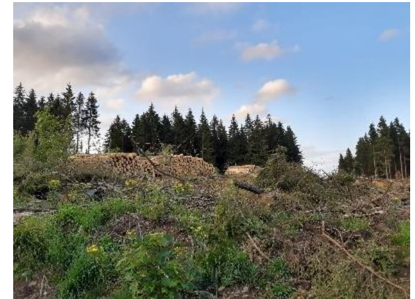
Weg zum Polstertaler Hubhaus bei Clausthal